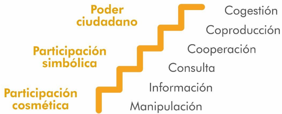
Il·lustració 1. Elaboración propia a partir del model de Arnstein